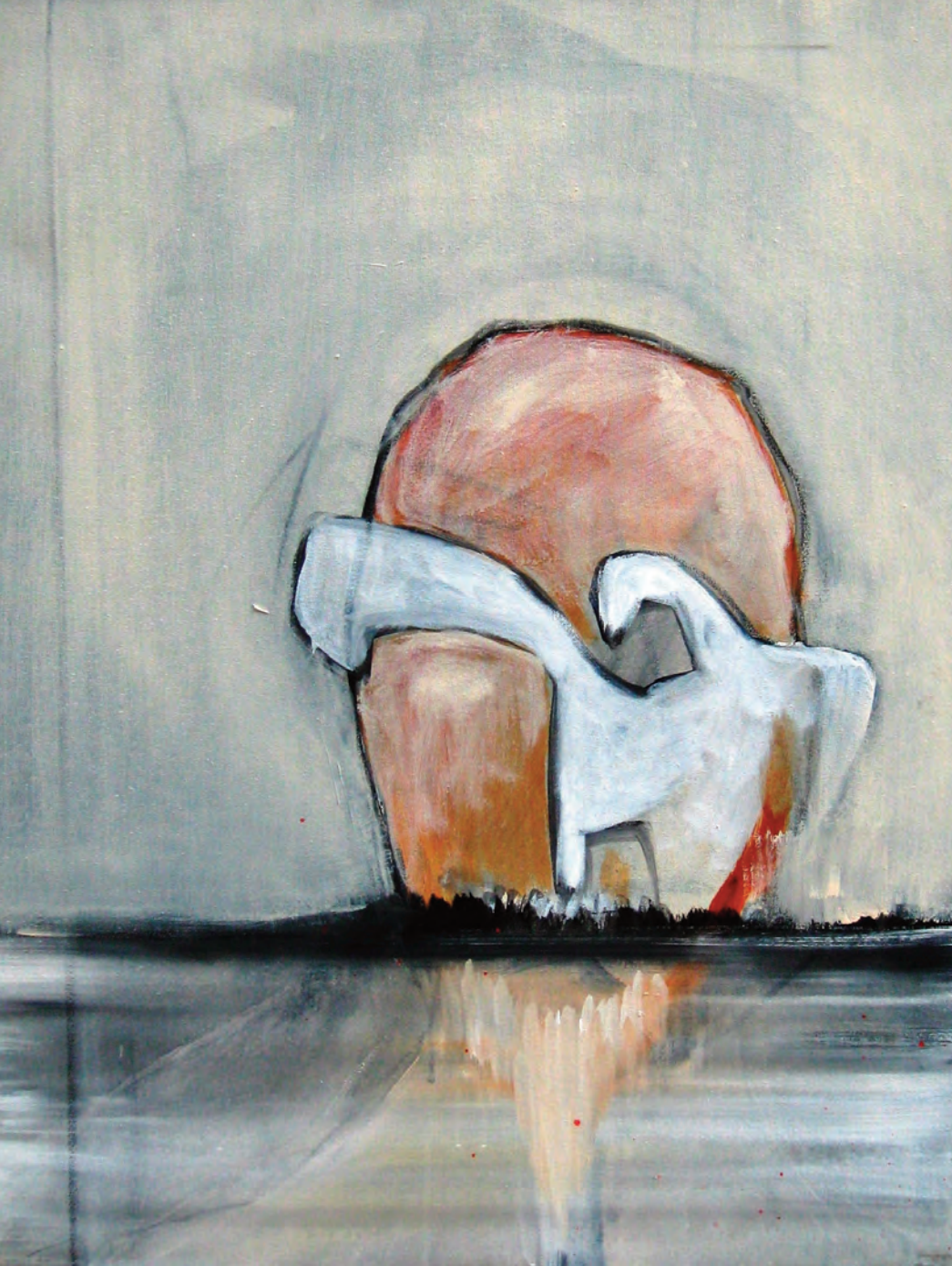
Katinka: Das wird ein gutes Bild.