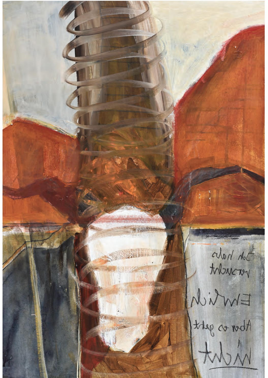
Katinka: Mit Wollen und Zulassen.